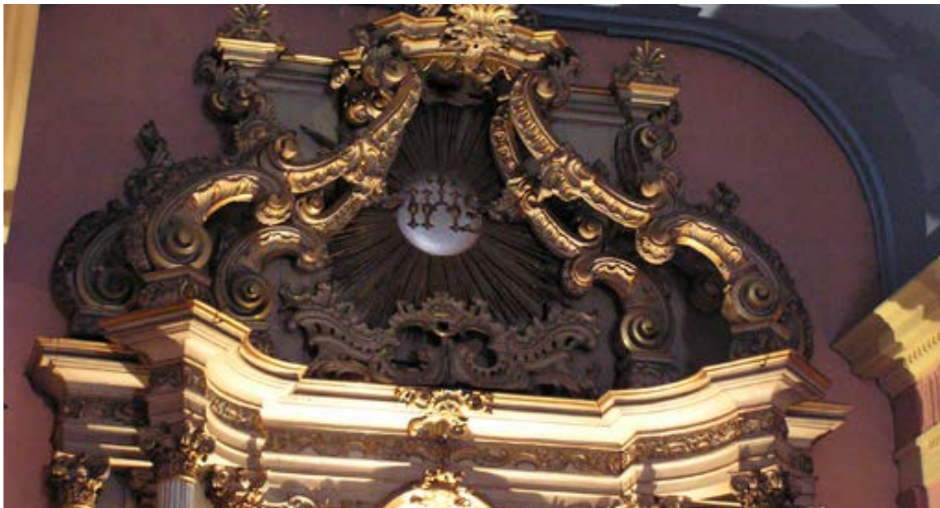
Detalle del retablo dedicado a San Ignacio en la iglesia de San Miguel, siglo XVIII.

de origen alemán expertos en diversos oficios. No fueron los primeros ni los últimos artesanos jesuitas que llegaron, pero el número de esta misión y el equipamiento que traían marcó un punto de inflexión decisivo.